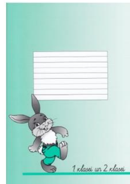
Burtnīca līniju 1. un 2. kl. Ražotājs: Zvaigzne ABC