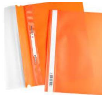
Plastmasas A4 ātršuvējs