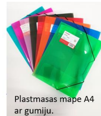
Plastmasas mape A4 ar gumiju.